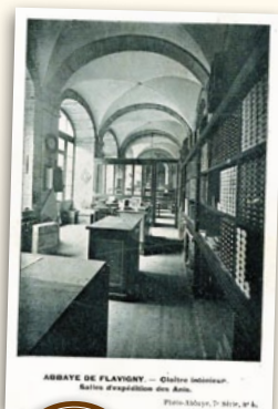
ABBAYE DE FLAYVIGNY - Cloître intérieur. Salles d'égoutillage des Anis. Plan: Musée, 71 - Anis, 07 6.